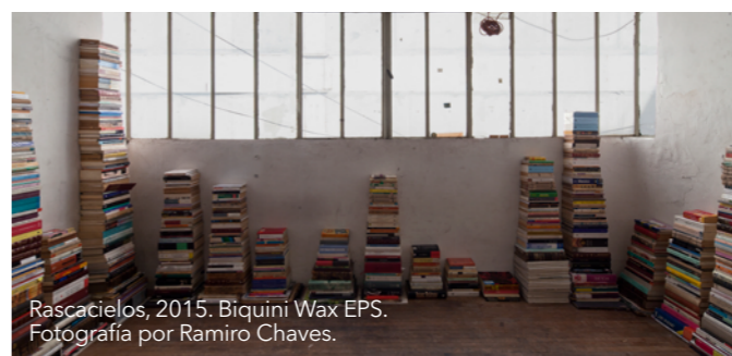
Rascacielos, 2015. Biquini Wax EPS.