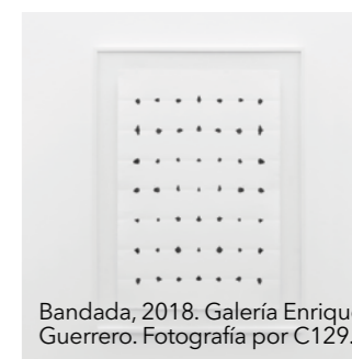
Bandada, 2018. Galería Enrique Guerrero.

seis camisetas, en color negro), para mi alimentación (una dieta suficiente para la nutrición y energía), etc. Sistemas. También veo mi vida y práctica como una transfiguración de mis actividades recreativas y de descanso en trabajo artístico. Por último, a veces resumo la vida como una lista (otro sistema) interminable de actividades por hacer que está cambiando constantemente: enlisto, elimino y agrego actividades sucesivamente. En el proceso van apareciendo nuevas actividades y la constante es ir depurando.