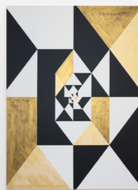
Zacuan, 2018. Chalton Gallery, curaduría por KRSTO.

digitales, también fotomontajes e impresiones. Cuando voy tomando seguridad en la idea, procedo a la ejecución de exploraciones y así sucesivamente hasta obtener un resultado satisfactorio. Tengo un método de trabajo que parte de las ideas para realizar exploraciones, bajo el hábito del registro y documentación en libretas y carpetas. Mantengo un archivo de libretas: personales, de notas, de conceptos y de producción; también uno de carpetas: para los proyectos en curso.